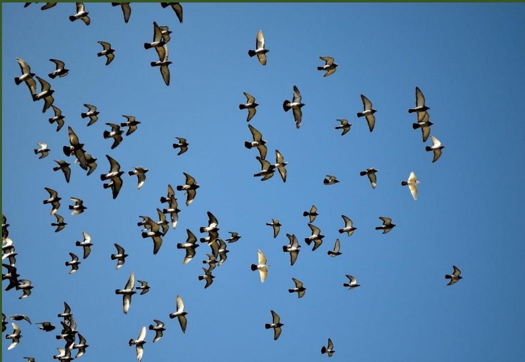
Hình Từ Internet---Dã-Thảo Trình Bày 19/08/2017

Hãy trả lại tự do cho tất cả tù nhân chính trị tại Việt Nam. Thank you!!!